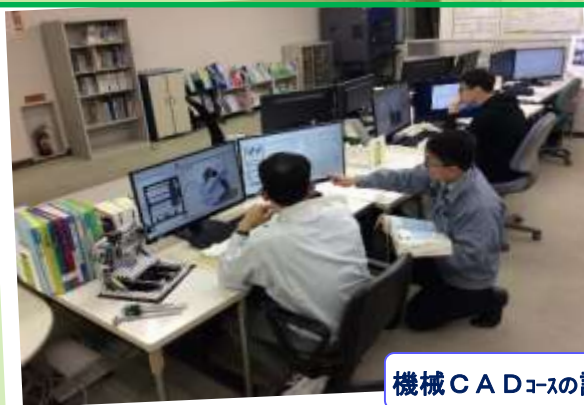
機械CADコースの訓練