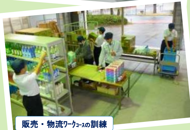
販売・物流ワークコースの訓練