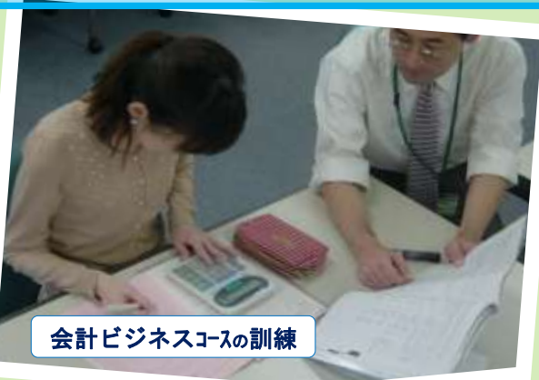
会計ビジネスコースの訓練