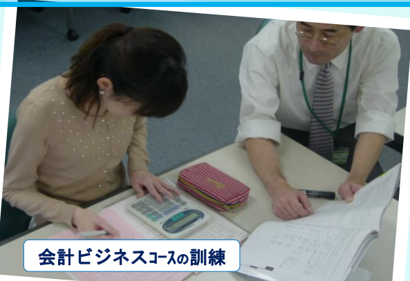
会計ビジネスコースの訓練