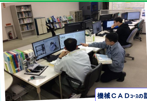
機械CADコースの訓練