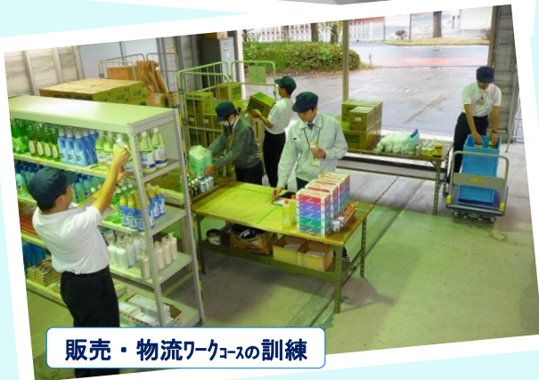
販売・物流ワークスの訓練