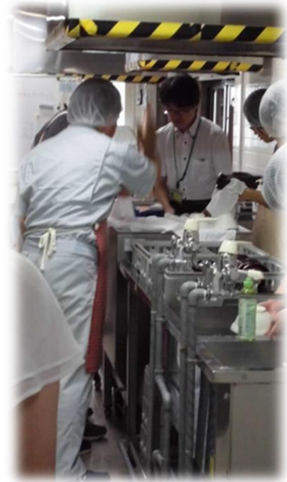
職業実務科（食器洗浄作業）