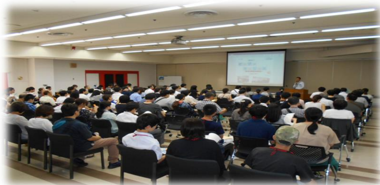
全体会(オリエンテーション、訓練説明など)