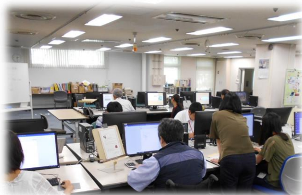
OA 事務科(ビジネス文書の作成)