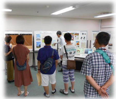
見学風景（DTP・Web技術科）