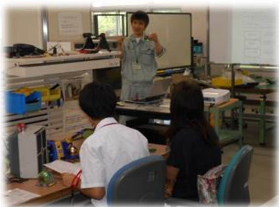
電子機器&テクニカルオペレーション科(イライラ棒の制作)