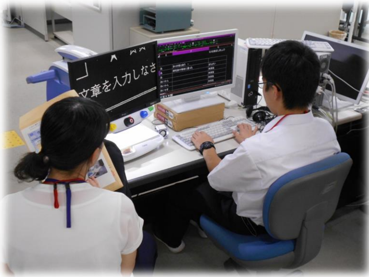
視覚障害者情報アクセスコース（画面拡大ソフトを使用した事務作業）