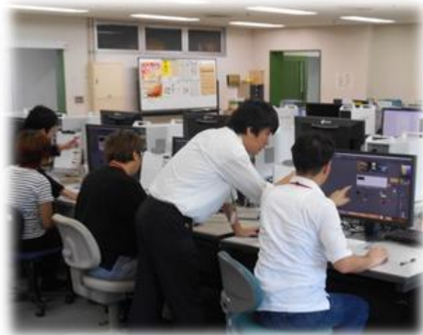
DTP・Web 技術科(リーフレットの作成)