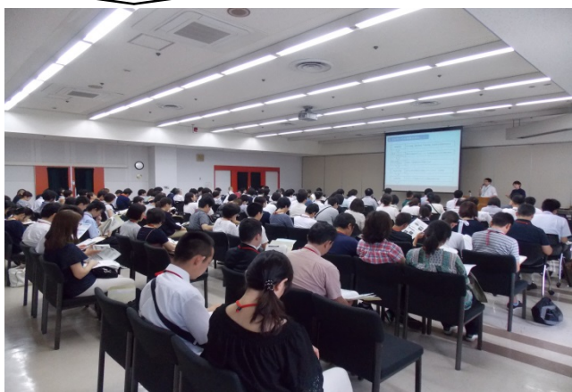
全体会の様子（職業訓練等の説明）